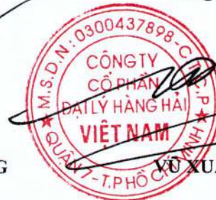
VÕ XUÂN TRUNG