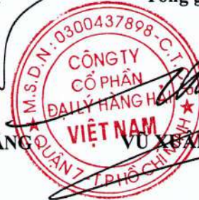
VU XUAN TRUNG